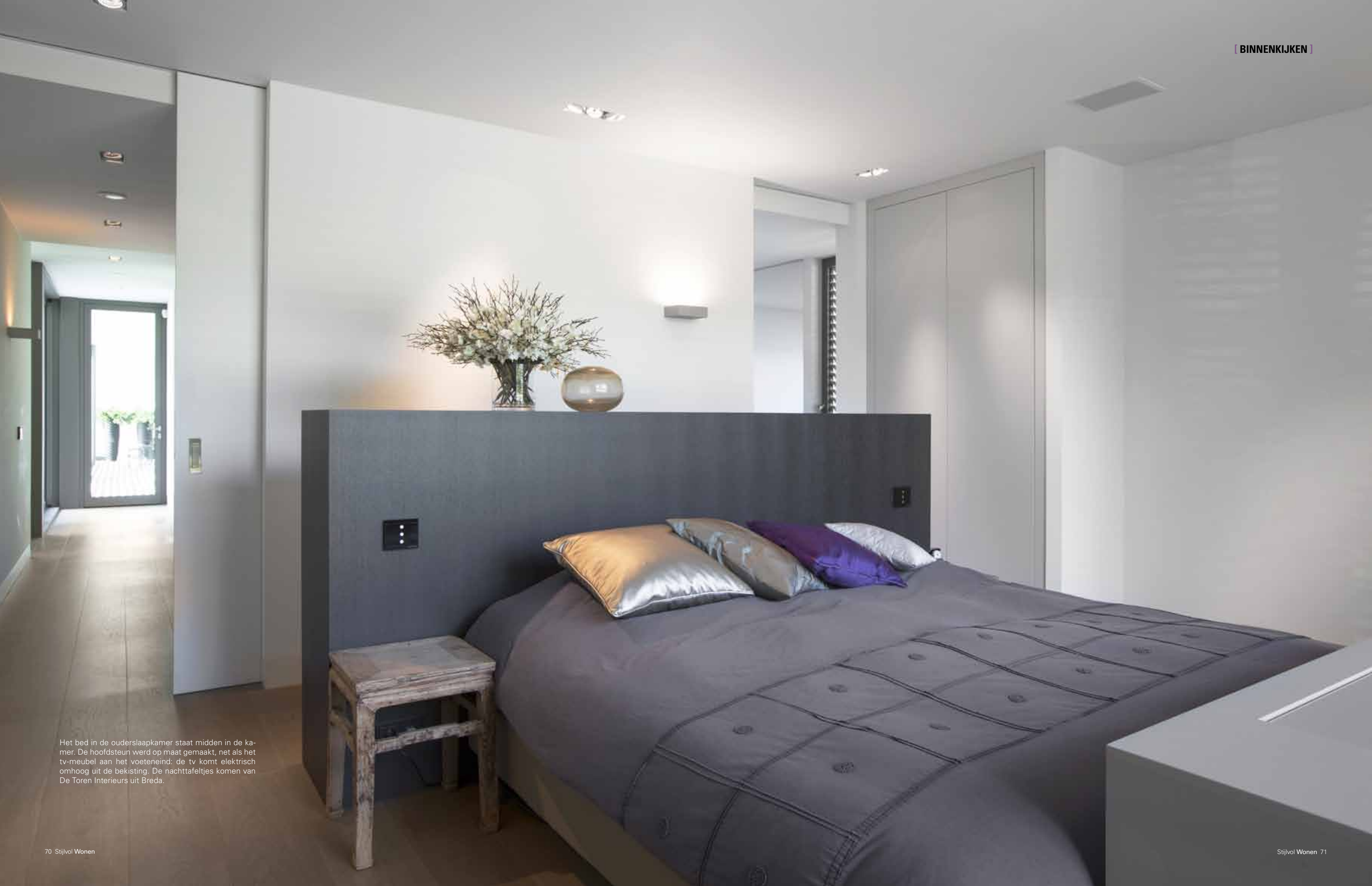
Het bed in de ouderslaapkamer staat midden in de kamer. De hoofdsteun werd op maat gemaakt, net als het tv-meubel aan het voeteneind: de tv komt elektrisch omhoog uit de bekisting. De nachttafeltjes komen van De Toren Interieurs uit Breda.