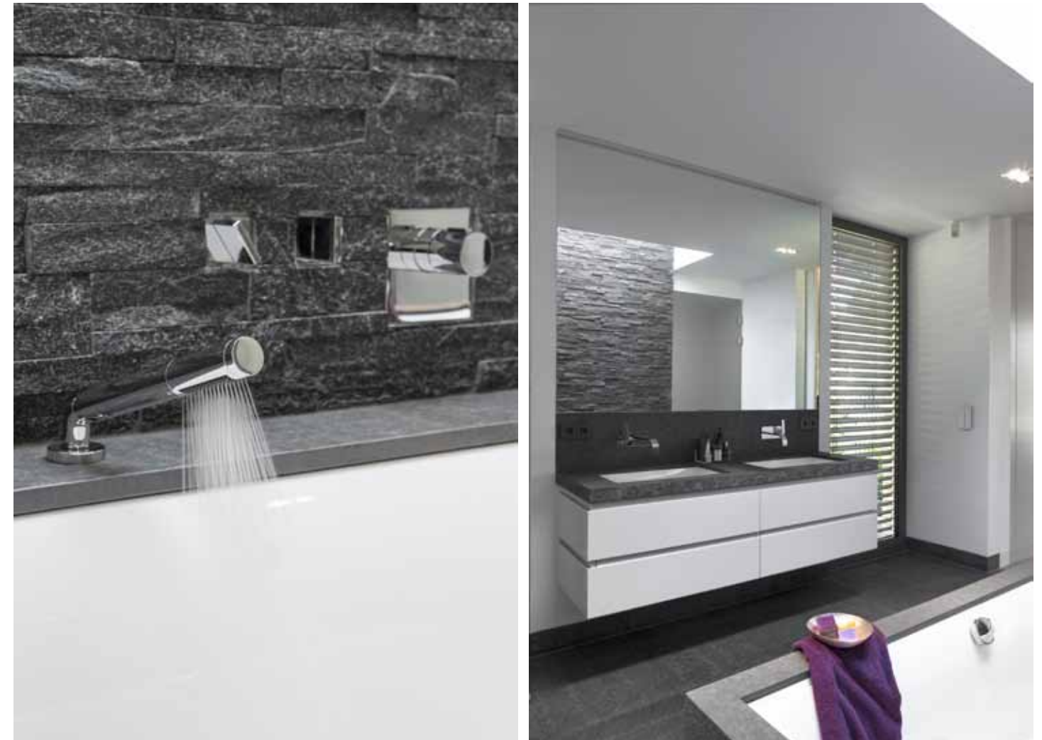
Het bad wordt weerspiegeld in een dakraam. De basaltstenen muur benadrukt hoogte, omdat hij voor het oog naar buiten doorloopt. Het kraanwerk is van MEM.

kunnen bijkletsen, borrelen en de krant lezen." Om het ruimtelijk effect te vergroten, verdeelde Erik de keuken in een zwart en wit gedeelte. De witte kasten vormen een hoge wand die is geïntegreerd in de muur. Het zwarte eiland, het activiteitscentrum van de keuken, krijgt daardoor alle aandacht.